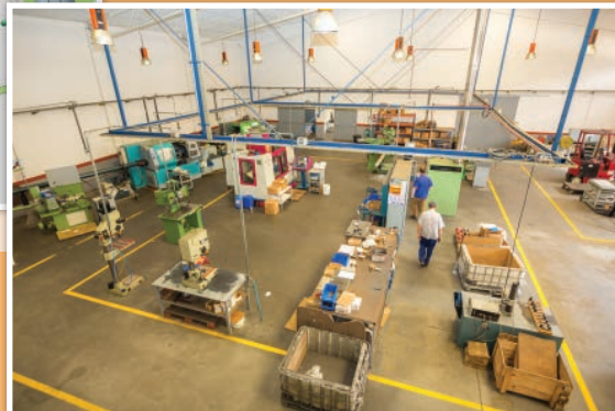
Nuestro proceso de fabricación.