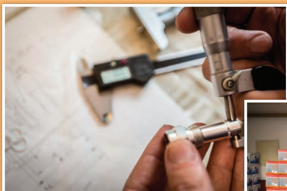
Nuestro control de calidad.