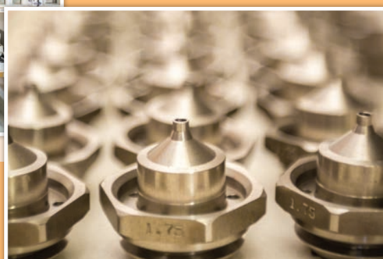
Nuestro almacén de piezas fabricadas.