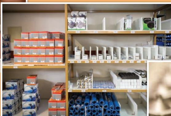
Nuestro almacén de producto acabado.