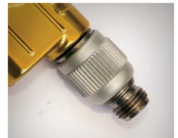
ACOE 1: Incluye nuevo minirregulador de aire.